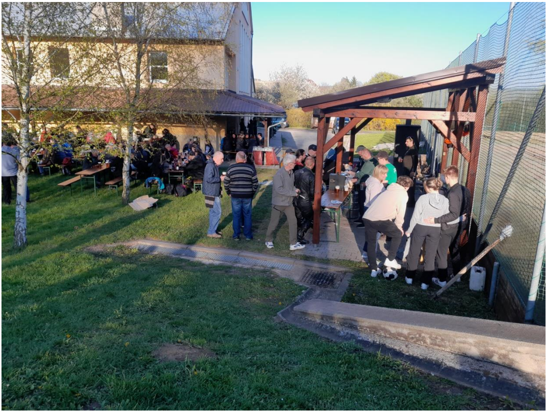
O obrovském zájmu více jak 100 lidí svědčí zaplněné posezení za kulturním domem