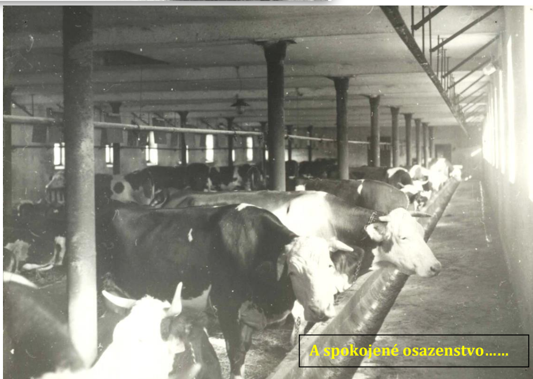
A spokojené osazenstvo.....

V další část vám přinesu několik zachovaných záběrů z let 60. a 70. ze střediska Vanovice i ukázky tehdejší techniky.