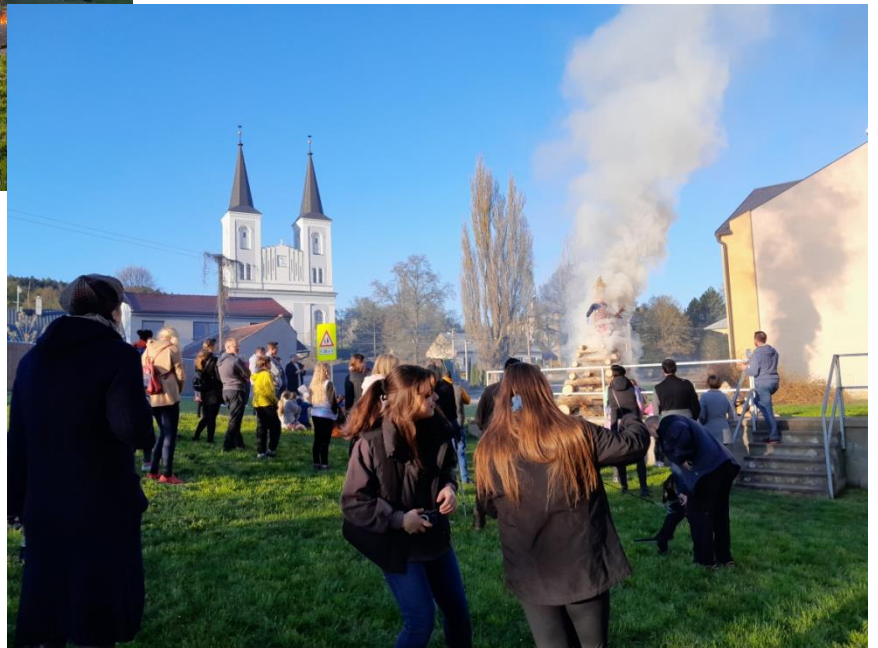
A pak to vzplálo.....