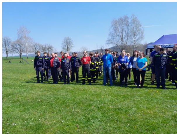
Nástup družstev na hřišti