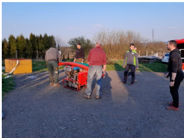
Soutěži předchází nácvik

O tom, že hasiči musí být vždycky připraveni svědčí i první soutěž hasičských družstev, tentokrát v Sudicích v sobotu 22. dubna. Přinášíme několik fotek.