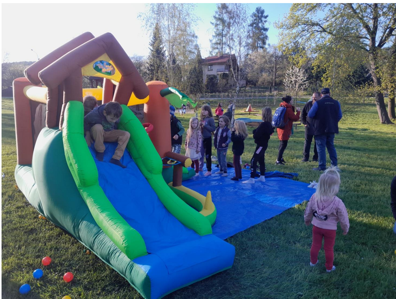
Na hřišti bylo na obecní skluzavce stále plno dětí