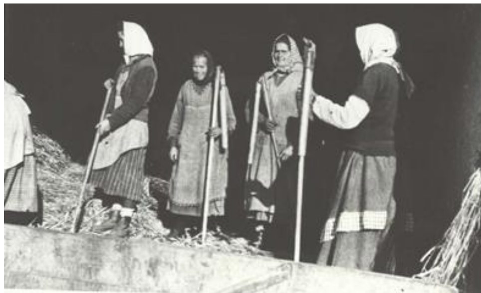
Mláčení cepy - rok 1936