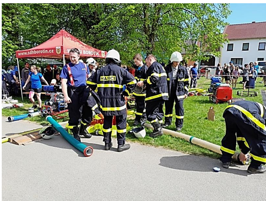
Hasičská soutěž v Borotíně