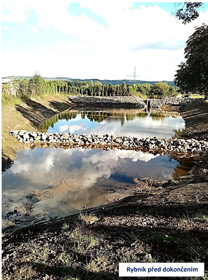
Rybník před dokončením