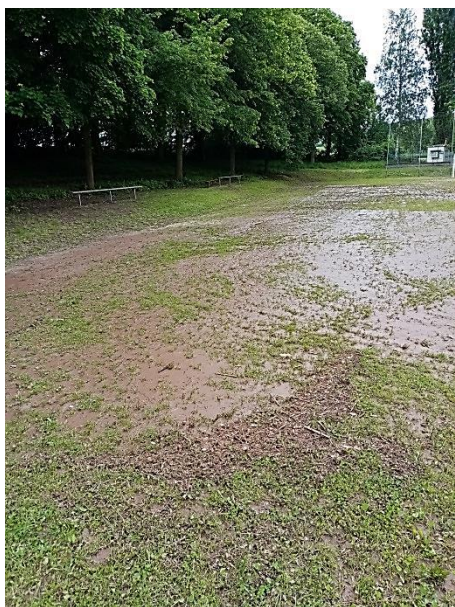
Fotbalové hřiště po přívalu bahna z pole