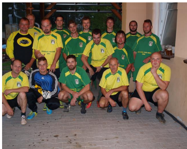
Foto účastníků letošního fotbalového utkání svobodní – ženatí. Proběhlo v pátek 1. září s výsledkem 0 : 0, na penalty zvítězili tentokrát ženatí.