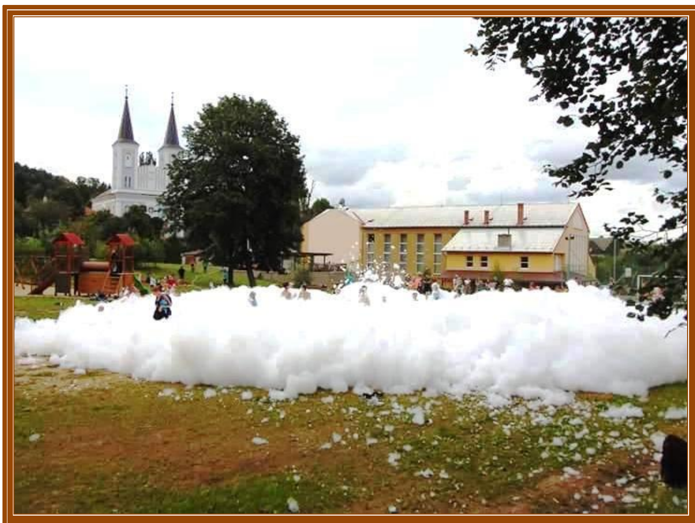
Loučení s prázdninami