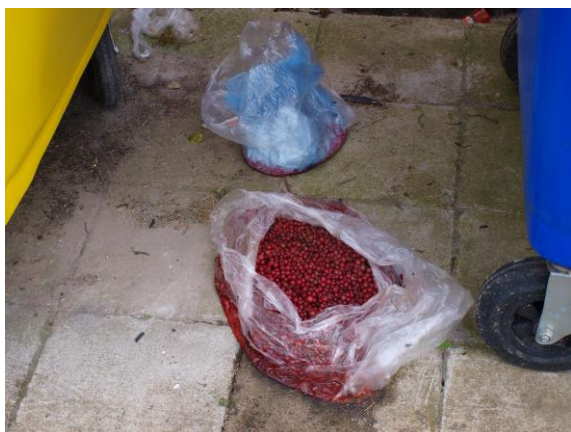
Máme snad kontejner na rybíz?