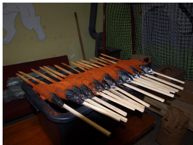
8. 7. 2017 - SDH Vanovice - Sousedské posezení za kulturním domem