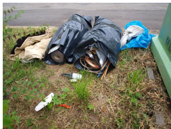
A co podlahové krytiny?