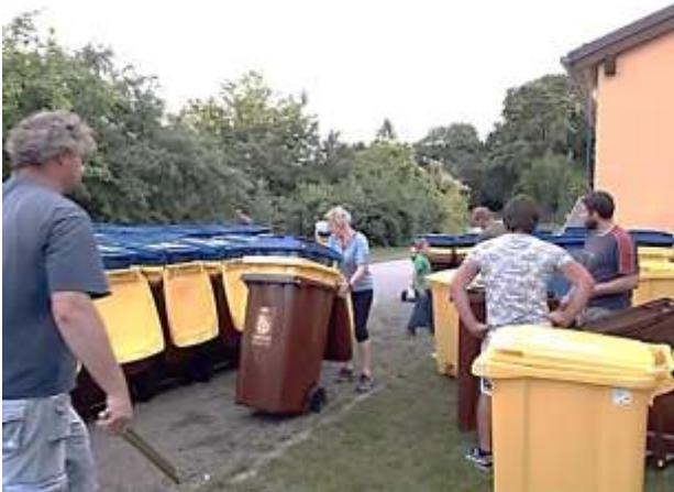
Výdej nádob na třídění

Výsledek v srpnu – pokles SKO o 46 %, proti období, kdy se netřídilo