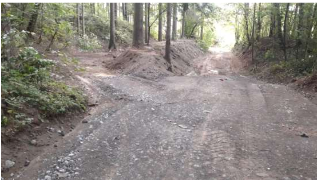
Suchý poldr k zachycení přívalového deště

Vyřeší nejen kvalitní příjezd ke hřbitovu, ale i zamezí přílivu vody při deštích z prostoru Kopanin