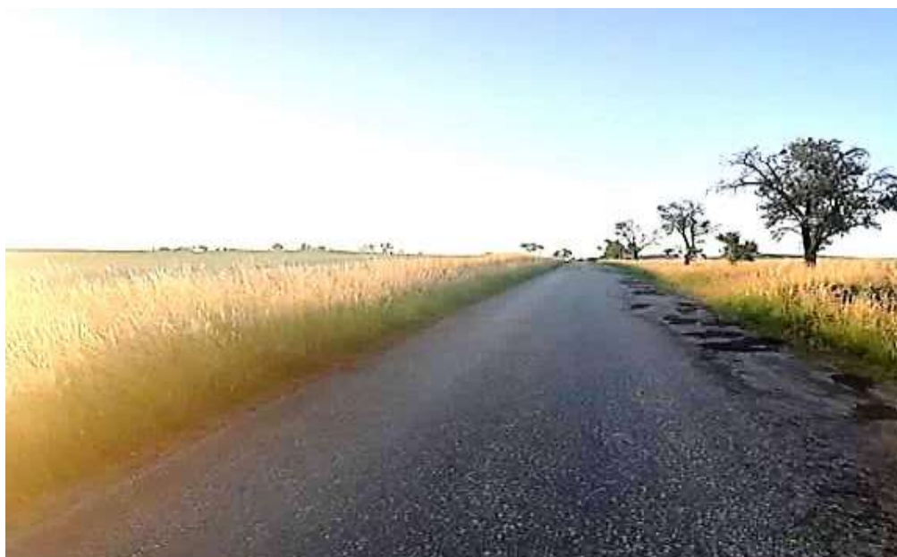
Snad se dočkají i krajnice vyžnutí. Drválovice-Paměťice