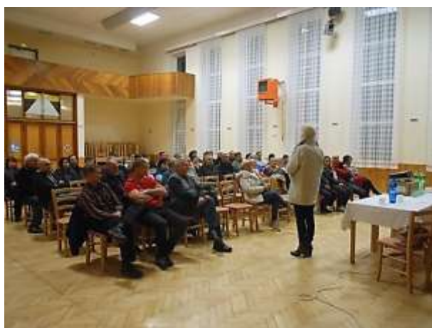
Beseda k třídění odpadů