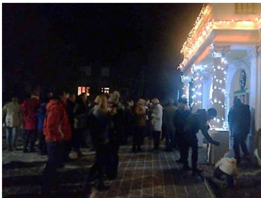
Adventní koncertík, rozsvěcování stromku a sousedská beseda