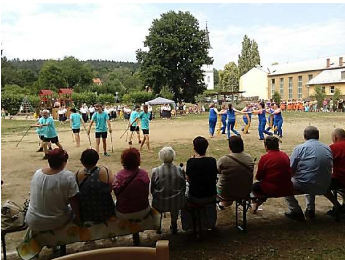
Slavnostní zakončení školního roku 2017/18 a předání vysvědčení - 29. 6. 2018