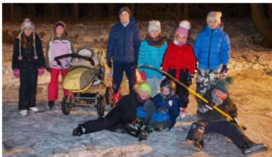
Z večerního bruslení