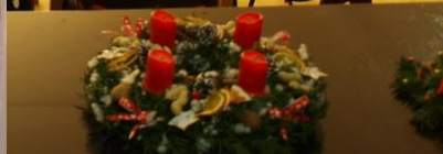
Z výroční schůze SDH Vanovice