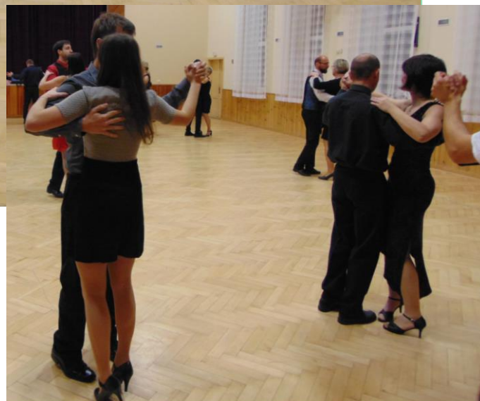
Několik momentek z tanečních pro dospělé