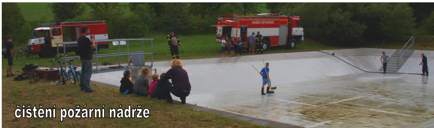
čištění požární nádrže