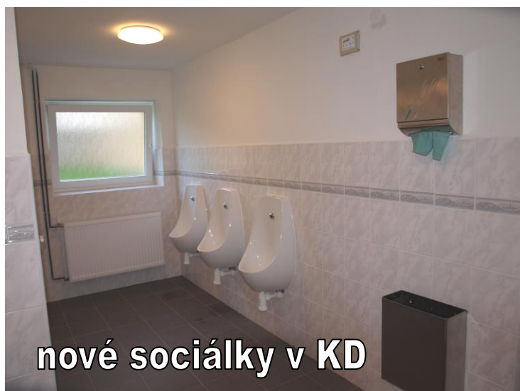
nové sociálky v KD