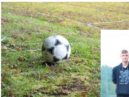
Z duelu svobodní - ženatí