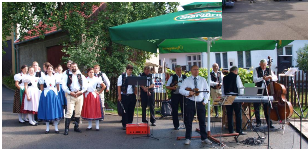
Malohanácké řemeslné jarmark 2016