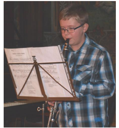
Adventní koncertík a punč při rozsvěcení vánočního stromu.