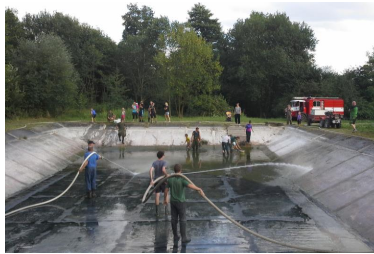
Z čištění hasičské nádrže v Křemílkách