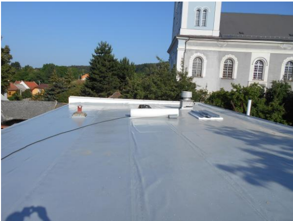
Opravená strecha školní kuchyně