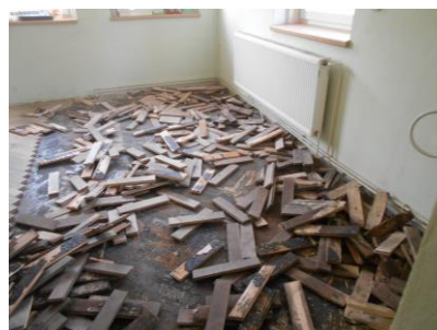
Oprava podlahy v KD