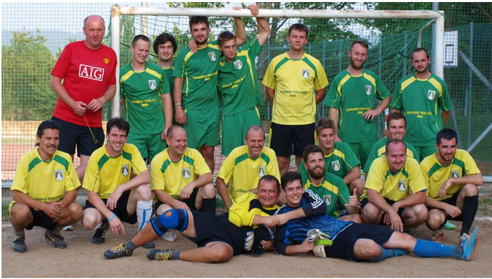
Mužstvo svobodných a ženatých po zápase