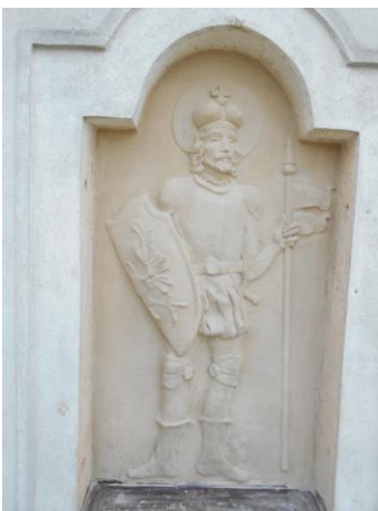
Opravená plastika na kostele sv.Václava